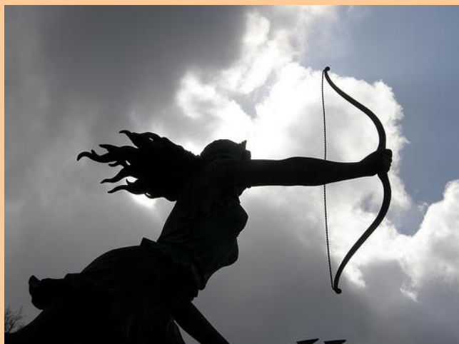
Fontana di Diana, di L. Mastrolenzi, Nemi

Far conoscere il territorio di Nemi, la sua poesia e la sua bellezza, anche a coloro che non hanno ancora avuto la possibilità di farlo, è l'intento dell' Associazione Aeneas Onlus.